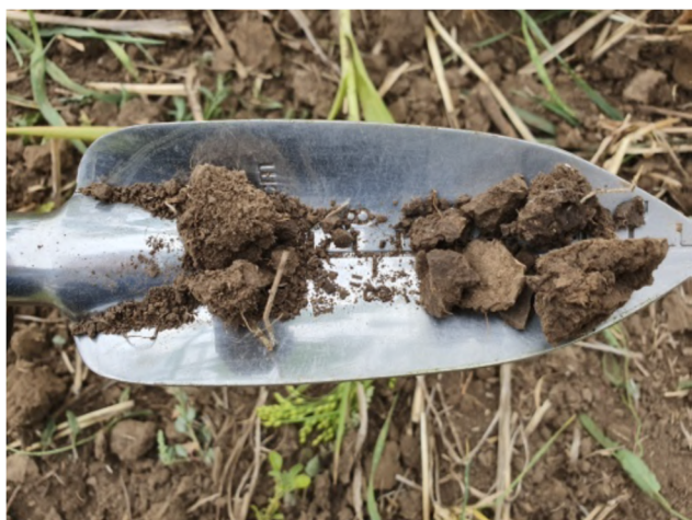
нульові технології (зліва) традиційні технології (справа)

Також дощові черв'яки є важливим компонентом біоти ґрунту й суттєво поліпшують функціональне різноманіття ґрунтової екосистеми. Їхня активність, як правило, пов'язана зі збільшенням стоку, інфільтрацією води, що вже після трьох років досліджень фіксувалася на ділянках за нульових технологій, завдяки посиленій шорсткості поверхні ґрунту та підвищеній макропористості. Візуальна різниця у структурності за різних технологій обробітку ґрунту представлена на рис. 2.